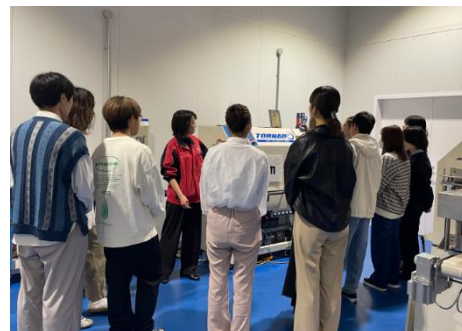
企業との打合せ風景・企業訪問時の工場見学風景