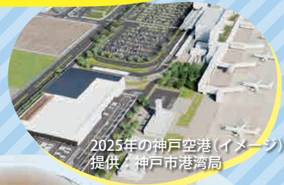
2025年の神戸空港(イメージ)