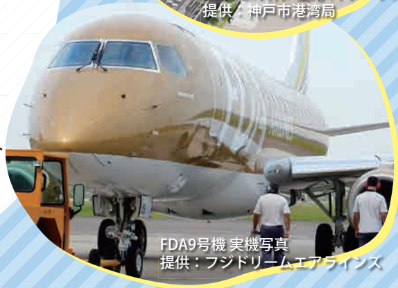
FDA9号機 実機写真